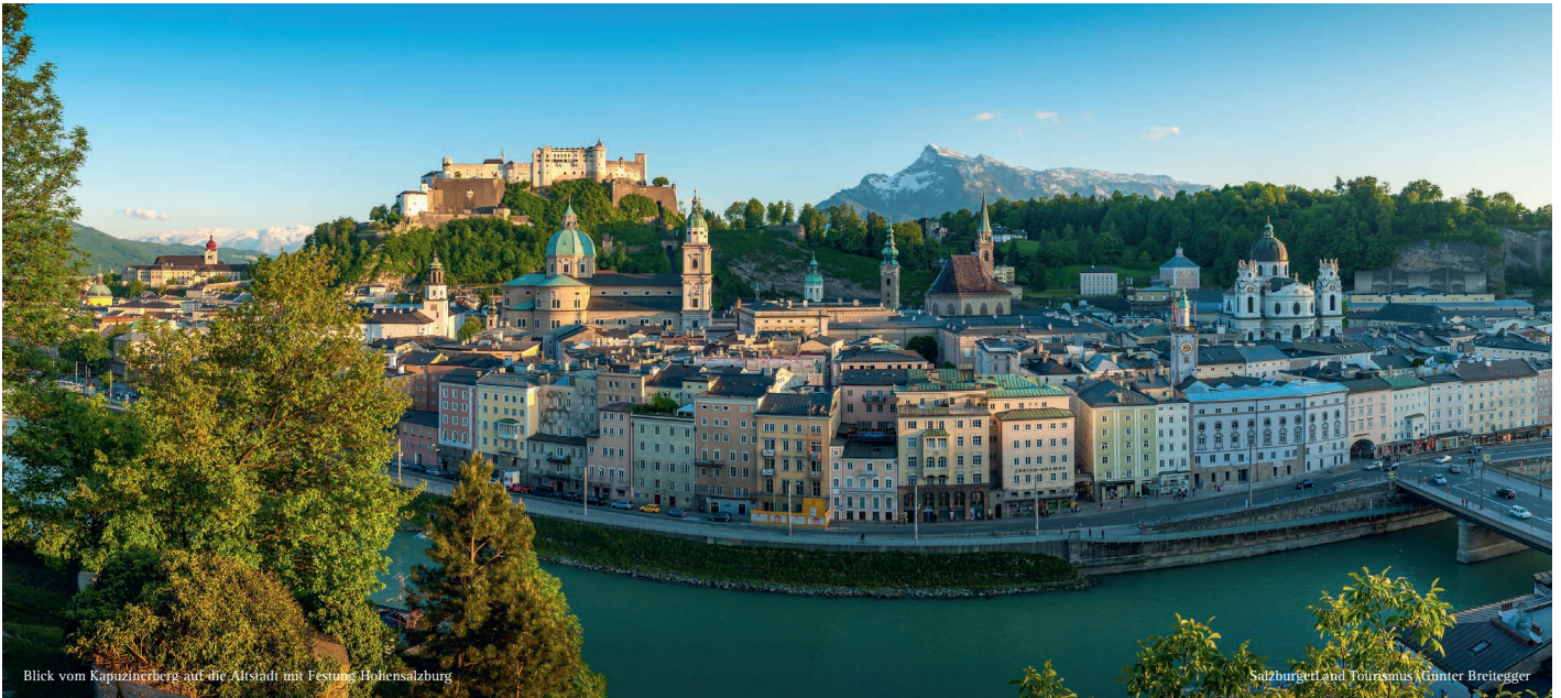
Blick vom Kapuzinerberg auf die Altstadt mit Festung Hohensalzburg